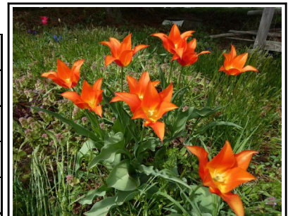
チューリップ/バレリーナ 前田地内/R8.4.23撮影