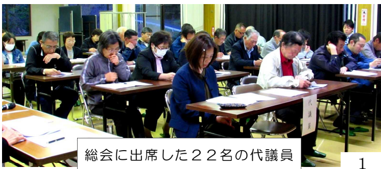
総会に出席した22名の代議員