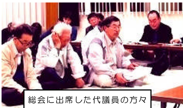
総会に出席した代議員の方々

昨年度に引き続きソフト事業に力を入れ、新規事業として高齢者がいつまでも健康で暮らせるよう筋力アップ講座を取り入れた「にこにこサロン」、またシニア世代対象の「きぬかわカレッジ」や女性を対象とした「ママカフェ」も継続します。更には、地域の農業や産業を考える「地域農業研修事業」などにも取り組みます。地域の方々も参加して、楽しく地域づくりを進めていきたいと思っております。