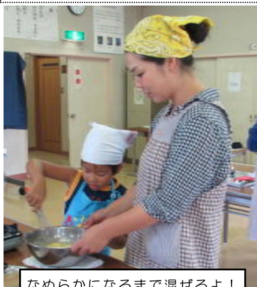
なめらかになるまで混ぜるよ！