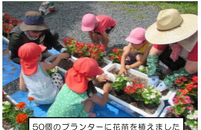
50個のプランターに花苗を植えました

その後、小山田駐在所周辺の沿道に設置し、水やりは小山田老壮会の皆様のご協力をいただきました。