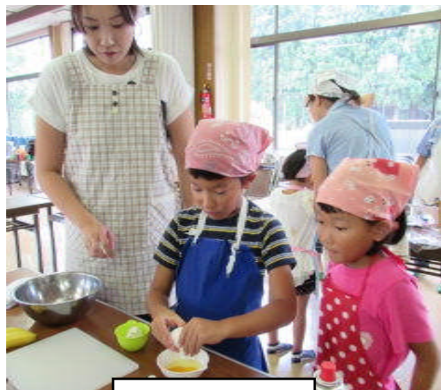
上手に割れるかな？

子どもたちは焼き上がったクレープ生地にチョコクリームとバナナを並べて上手に作っていました。作りたてのクレープを食しながらお母さん同士は子育て環境について意見交換をしました。