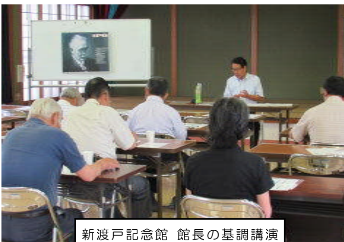
新渡戸記念館 館長の基調講演

同28日（火）には芸術と文化に触れるをテーマに、本市の友好姉妹都市である十和田市へ25名が移動学習を行いました。大変勉強になったとの感想を多数いただきました。