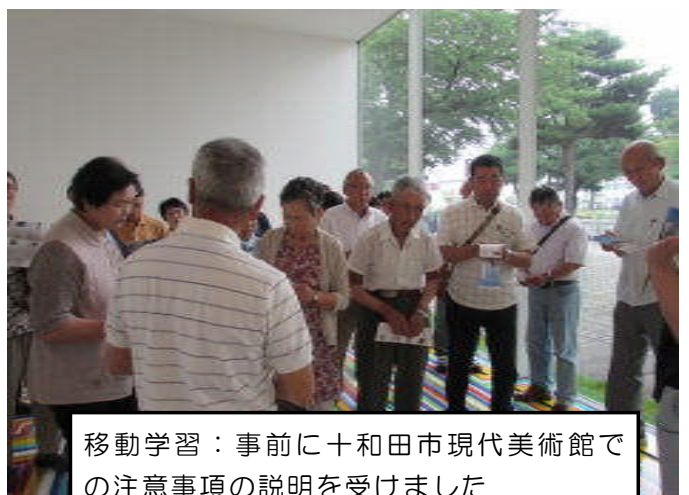
移動学習：事前に十和田市現代美術館での注意事項の説明を受けました