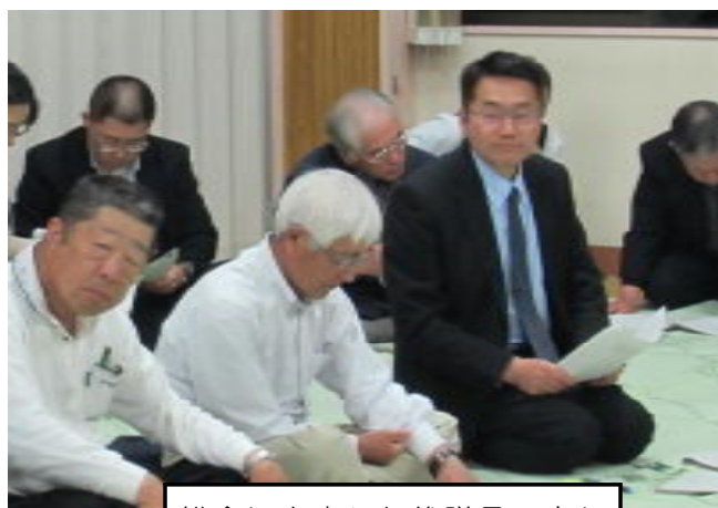
総会に出席した代議員の方々